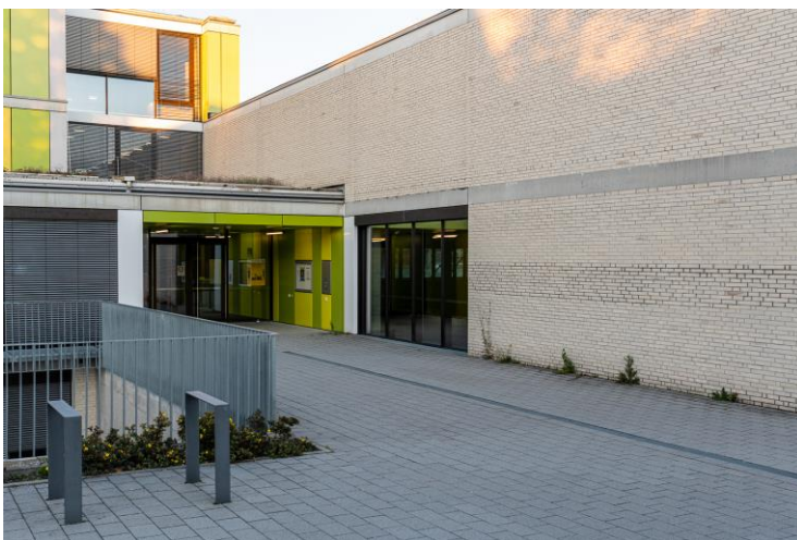
Fußgängerzugang zur Halle an der Markgrafen-, Ecke Vogesenstraße